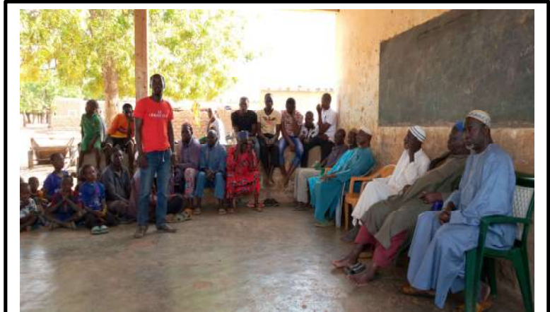
Animation avec le comite de ciblage a sankonde-Kongoussi