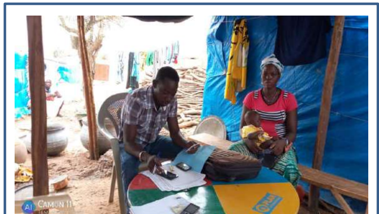
Enregistrement des donnees des menages identifies sur ODK