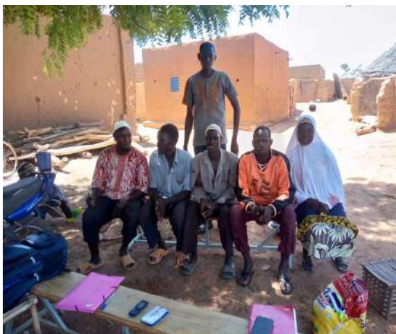
Certification avec la presence des services techniques