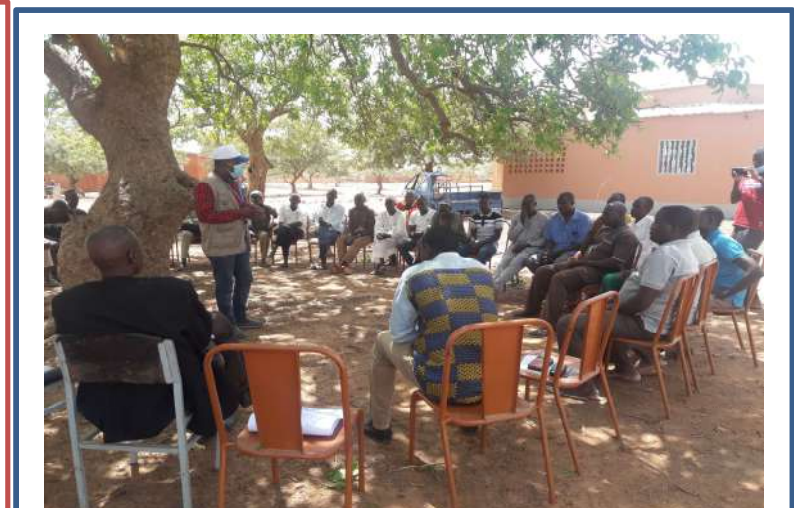
Validation de la liste a Bourzanga en presence de l'equipe